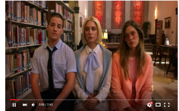
Отрывок из сериала «Политик» смотрите по ссылке-->

https://drive.google.com/file/d/13J5zZmg74B1hYBYwXXN8YgixatmHxq-O/view?usp=sharing