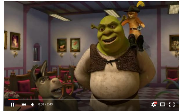
Отрывок из мультфильма «Шрек-2» смотрите по ссылке-->

Социальные сети за рубежом активно используют все профсоюзные сообщества в качестве одной из форм организации взаимодействия между профсоюзным движением и внешним миром.